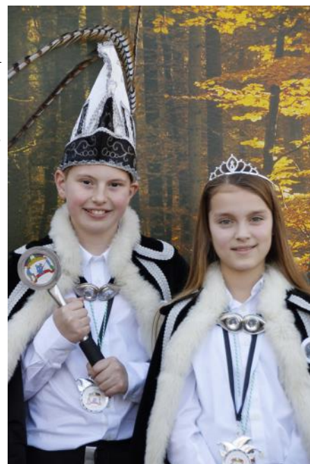
CSTT en de Boezels.